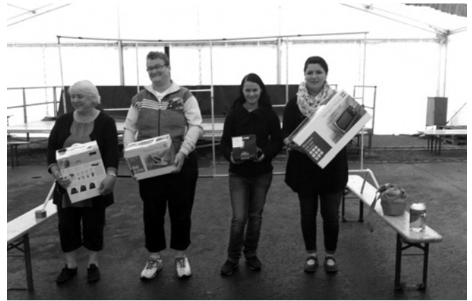
Gewinnerinnen beim Maßkrugstemmen der Damen

Die Einwohner von Kraschwitz und Wilchwitz haben dieses Jahr fleißig für die große Festtombola gespendet, vielen Dank. Klasse war auch, dass so viele Kuchenspenden eingegangen sind.