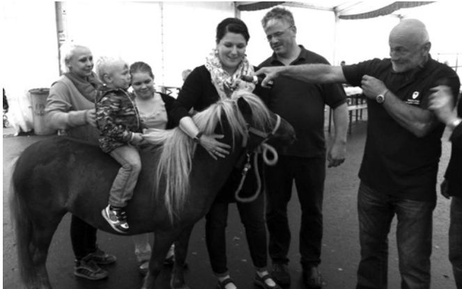
Taufe des Ponys auf den Namen „Monic“