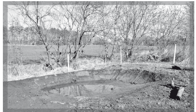
Anfang März 2013 wurden drei Amphibien-Laichgewässer angelegt.