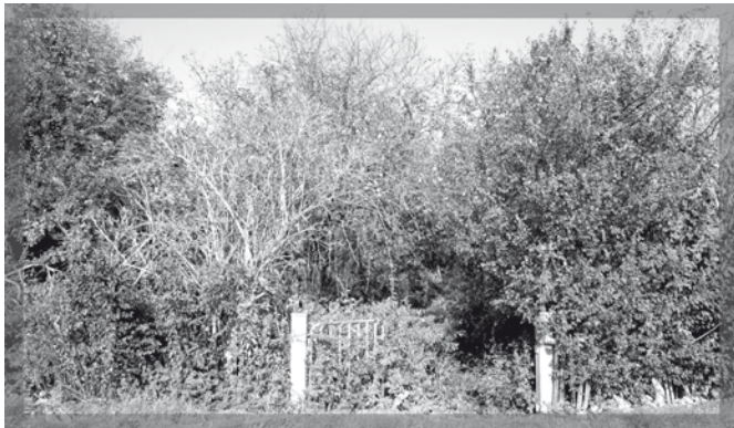
Im Herbst 2012 schlummerte das alte Gartengrundstück noch unter einer dichten Brombeerhecke.

Ziel war es, eine Streuobstwiese mit alten Kernobstsorten wie z. B. den Äpfeln Minister Hammerstein, Croncals, Zuccamaglio, Ontario oder Schöner von Boskop inmitten der intensiv landwirtschaftlich genutzten Sprotteaeue als zusätzlichen Lebensraum für bedrohte Tier- und Pflanzenarten zu schaffen. Frösche, Kröten und Molche aber auch ein Schmetterling mit dem Namen Dunkler Wiesenknopf-Ameisenbläuling sollen dort in ihrem Bestand gesichert werden. Der kleine Falter beispielsweise weist eine spannende Lebensgeschichte auf. Nur mit Hilfe einer einzigen Raupenfutterpflanze, dem Großen Wiesenknopf, und zwei verschiedenen Ameisen-Arten kann sein Überleben gesichert werden. Fehlt beispielsweise der Große Wiesenknopf, finden die Falter keine Möglichkeit zur Eiablage. Fehlen die Ameisen, können sich die Raupen nicht entwickeln. Der Fortbestand des Falters ist in Gefahr.