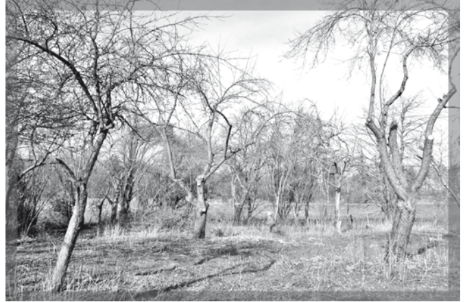
Dank vieler Helfer ist die Struktur der alten Streuobstwiese wieder erkennbar (Februar 2013).

Seit 2013 ist die Fläche vollständig im Besitz der Stiftung „Nationales Naturerbe“ des Naturschutzbundes Deutschland (NABU). Mit dem Beginn des von EU und Freistaat Thüringen finanzierten ENL-Projektes (Entwicklung von Natur und Landschaft) „Sprotteaeue und FFH-Eremit-Lebensräume, Altenburger Land“, welches am Naturkundlichen Museum Mauritani-um in Altenburg angesiedelt ist, setzten auch die ersten Aufräumarbeiten in Saara ein.