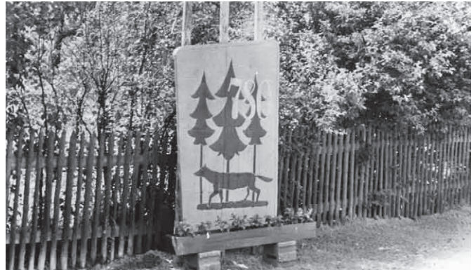
Am Ortseingang von Ehrenhain aus Richtung Nirkendorf kommend steht dieses Werbeplakat zur 780-Jahrfeier. Als Symbol die drei Fichten und ein nach links laufender Fuchs.

Zur 780-Jahrfeier von Ehrenhain im Jahre 1960 wurde der Fuchs und die drei Nadelbäume erstmalig am Ortseingang von Ehrenhain aus Richtung Nirkendorf kommend als Werbeplakat zur 780-Jahrfeier verwendet.