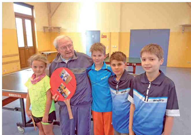
Gratulation durch die „Nachwuchsabteilung Tischtennis“ des TSV Lehndorf e. V.