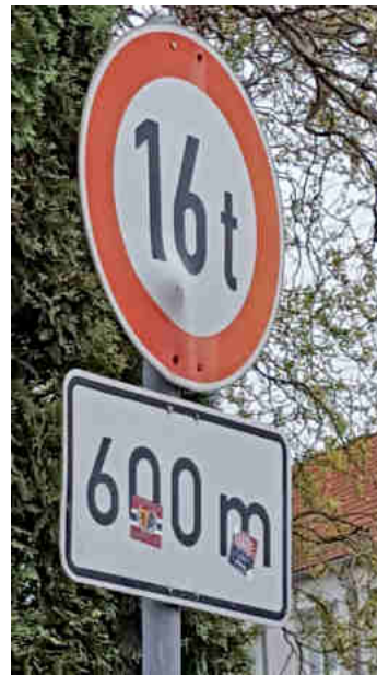
Verkehrszeichen in Zehma

Besonders unschön ist natürlich auch der Anblick solcher Müllhaufen. Wer seinen Abfall in die Natur wirft, begeht eine Ordnungswidrigkeit, die mit einem erheblichen Bußgeld geahndet wird. Zudem ist die Ablagerung von Grünschnitt in Straßengräben und an Uferböschungen verboten. Neben dem Tatbestand der Ordnungswidrigkeit stellt