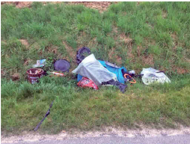
Landwirtschaftsweg Kirschallee (Ehrenhain-Großmecka)

Des Weiteren werden vermehrt Straßenschilder, Wegweiser und Leitpfosten Opfer von Sachbeschädigungen durch rohe Gewalteinwirkung oder durch das Beschädigen durch Aufkleber. Eine Reinigung der Schilder ist in den meisten Fällen unmöglich, da der Leim der Aufkleber die reflektierende Folie der Straßenschilder zerstört. Eine Erneuerung der Straßenschilder beträgt ca. 100 Euro pro Schild. Diese Kosten müssen von dem jeweils zuständigen Straßenbaulastträger (Gemeinde Nobitz, Landkreis Altenburger Land, Straßenbauamt Ostthüringen) getragen werden, sofern sich ein Verursacher nicht ermitteln lässt. Insbesondere bei den Schildern, die durch die Gemeindeverwaltung zu ersetzen sind, schlägt sich die Erneuerung auf den Gemeindehaushalt nieder. Diese eigentlich unnötige Finanzierung erfolgt durch Steuergelder und ist somit indirekt von den Bürgern der Gemeinde zu tragen. Zudem muss zusätzlich Personal abgestellt werden, um die beschädigten Gegenstände wieder zu reparieren.