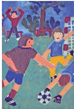
Heiko Uhlemann, Kl. 5 „Ich bin Tormann“

Sie sind ein besonderes Dokument, wie die Kinder ihre Empfindungen und Erfahrungen auf bildnerische Weise wiedergegeben haben und wie gut sie zeichnen und malen konnten.