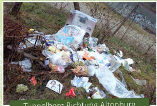
Tunnelberg Richtung Altenburg

Widerrechtlich beseitigter Müll stellt eine Gefahr für Tiere dar, sie fressen die Abfälle und können davon krank werden. Weiterhin können sich Tier und Mensch, besonders Kleinkinder beim Spielen, an weggeworfenen Glas- und Metallabfällen verletzen.