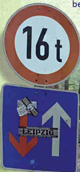
Verkehrszeichen in Zehma