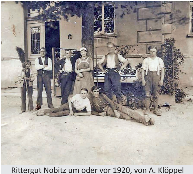
Rittergut Nobitz um oder vor 1920, von A. Klöppel

Heute zeigen wir ein Foto, welches so ca. 1920 auf dem Nobitzer Rittergut gemacht wurde. Vielleicht erkennt ein Leser Verwandte auf dem Foto und kann das Jahr, wann das Foto gemacht wurde, genauer benennen.