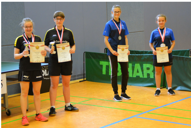
Siegerehrung Mädchen 18 Doppel