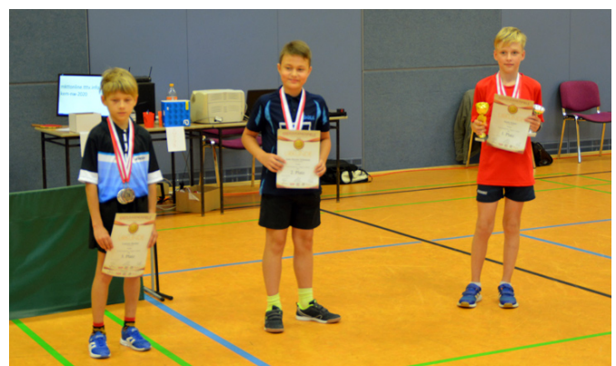
Siegerehrung Jungen 11 Einzel

Die meisten Teilnehmer stellten der Lehdorfer TSV 1893 e. V. (11) und SV Aufbau Altenburg e. V. (9). Um alle Maßnahmen des Infektionsschutzkonzeptes umsetzen zu können, wurden unter anderem an zwei Tagen die einzelnen Konkurrenzen zeitversetzt ausgetragen.