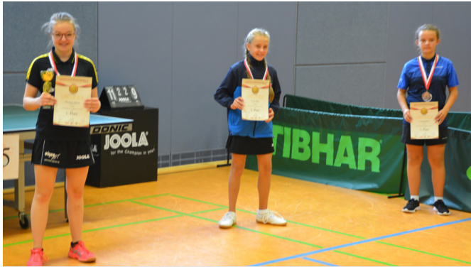
Siegerehrung Mädchen 15 Einzel