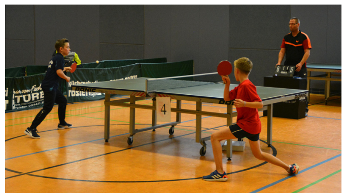
Finale Jungen 13 Einzel

Nachdem bereits Anfang März 2020 die Kreisjugendspiele der Nichtaktiven stattfanden, wurden nun die diesjährigen Kreisjugendspiele der Aktiven in der Nobitzer Mehrzweckhalle ausgetragen. Vierzig Kinder und Jugendliche aus sieben Vereinen des Altenburger Landes kämpften, unter außergewöhnlichen Umständen, nach einer langen Wettkampfpause nicht nur um die begehrten Pokale und Medaillen, sondern auch um die Qualifikation zu den Ostthüringer Bezirksmeisterschaften.