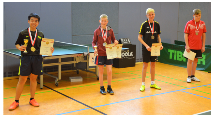
Siegerehrung Jungen 18 Einzel