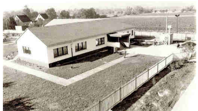
Eröffnung am 7. Oktober 1989

Für das leibliche Wohl und einige Überraschungen für Jung und Alt ist an diesem Tag bestens gesorgt. Wir freuen uns auf den Besuch der Kita-Kinder mit deren Familien sowie Ehemalige und Interessierte.