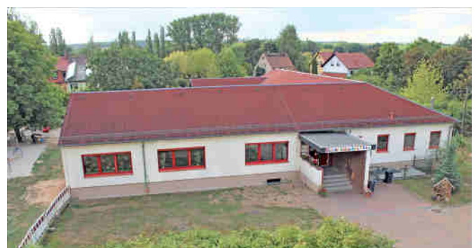
Fast 30 Jahre später im September 2019

Antje Röhnert, Leiterin Kindertagesstätte „Haus der kleinen Füße“