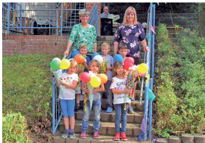
Die Erzieherinnen der Kita „Sonnenschein“ Podelwitz