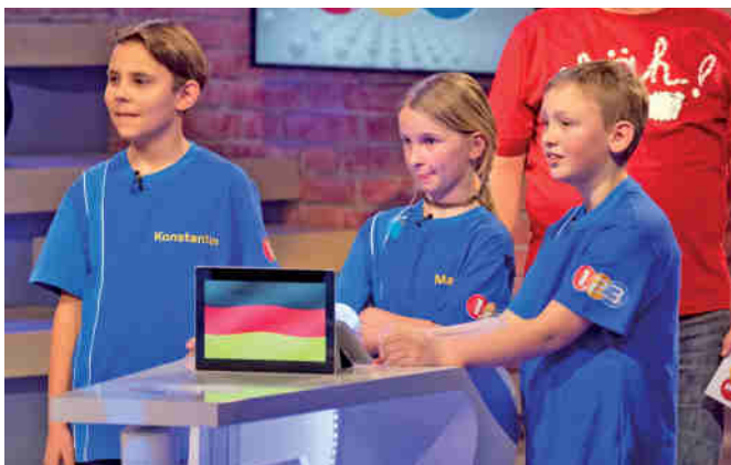
Die Kandidaten aus Langenleuba-Niederhain/Deutschland strengten sich ganz besonders an, um den Tagesieg einzutüten.

Die drei Ratekinder belegten leider nicht den ersten Platz, aber bereits die Teilnahme war ein Erfolg. Alle Teilnehmer erhielten eine Medaille. Den „Piet Flosse Pokal“ erspielten sich die Kandidaten aus Athen/Griechenland.