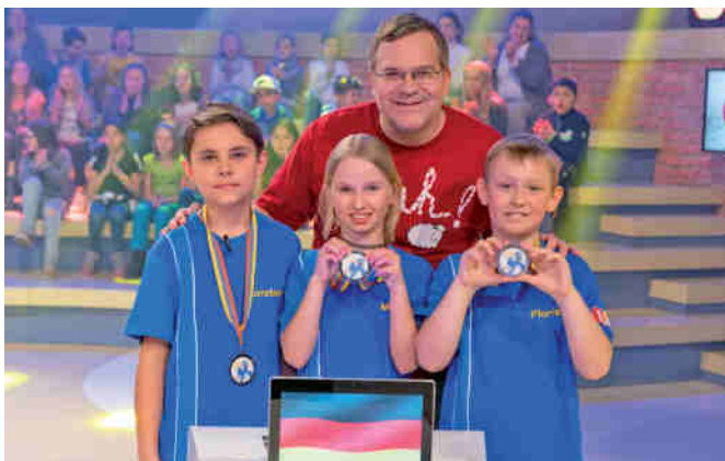
Die Kandidaten aus Langenleuba-Niederhain/Deutschland mit Elton.

Die drei Ratekinder belegten leider nicht den ersten Platz, aber bereits die Teilnahme war ein Erfolg. Alle Teilnehmer erhielten eine Medaille. Den „Piet Flosse Pokal“ erspielten sich die Kandidaten aus Athen/Griechenland.