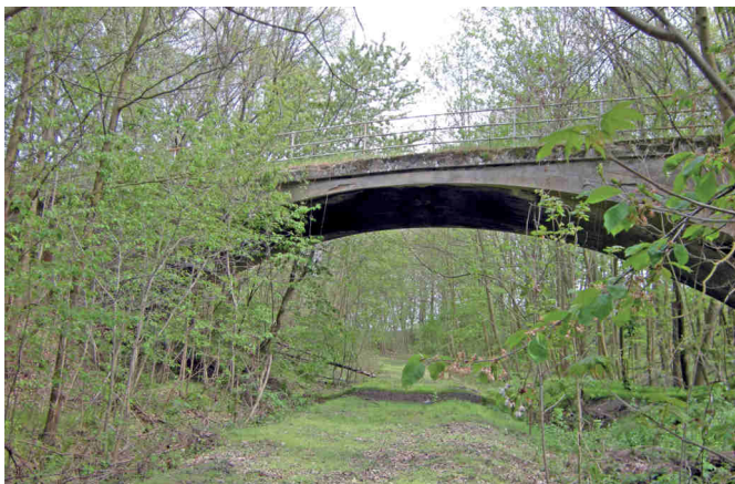
Gleisbett der alten Bimmelbahn in der Gösse bei Nobitz

Dar Summerreen hodde uffgehiert, de Sunne die kom raus. Ich wannerte in de Leine, iwer Nidderleipten naus. Dengenonger am Spannerbache, dar mumelte ganz leise, de Schneiße simne non, hen ze dar grußen Eiche. Die lud mich ei ze raste, ich leete mich onger die Eeche, ins schiene frische Groos, ins griene Moos, das weeche. Su log ich nu im Schatten, un begann ze lauschen denn iwer mir ausn Wipfel, vernohm ich ee leises rauschen. Dar sanfte looe Summerwend, scheelte mit dan Zweischen, de Blätter dar olln Eeche, die tanzten ehrn Reischen. Entspontt hiert ich ne Weile dam Schpeel des Wendes zuu, un fand in mein Gemiete, Zefreedenheet und Ruh. Die Eeche hoot mich eigeloden, de Beene auszeruchen, dernooh gink mei Waak weiter, onger dan machtjen Buchen. Ich kom dann an eene Lichtung, glei uum am Himmelreiche, do shtong uff eener kleen Weese noch ne gruße Eiche.