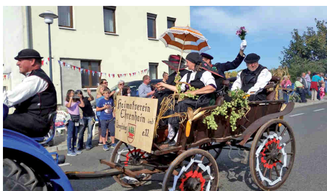
Sigurd Kyber/Vorsitzender