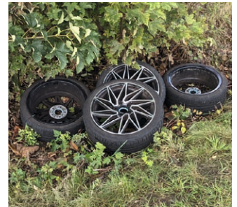
Autoreifen mit Felgen zwischen Ziegelheim und Engersdorf (Heiersdorf)

Die Beseitigung des Abfalls verursacht hohe Kosten für das Landratsamt Altenburger Land (als zuständige Behörde) und die einzelnen Straßenbaulastträger (Bund, Land, Gemeinden). Diese unnötige Finanzierung erfolgt durch Steuergelder und muss somit indirekt von allen Bürgerinnen und Bürgern mitgetragen werden.