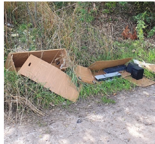
Schrank mit Musikanlage am Silo bei der Bockaer Straße in Kraschwitz

Immer wieder werden widerrechtliche Abfallablagerungen (Asbest, Sperrmüll, Essenreste, Kompostierhaufen, Häckselgut, Plastiksäcke, alte Autoreifen usw.) auf den ländlichen Wegen, an Straßenkörpern und in den Waldstücken der Gemeinden vorgenommen. Zuletzt betraf es insbesondere Kraschwitz, Nobitz, Engersdorf und Ziegelheim.